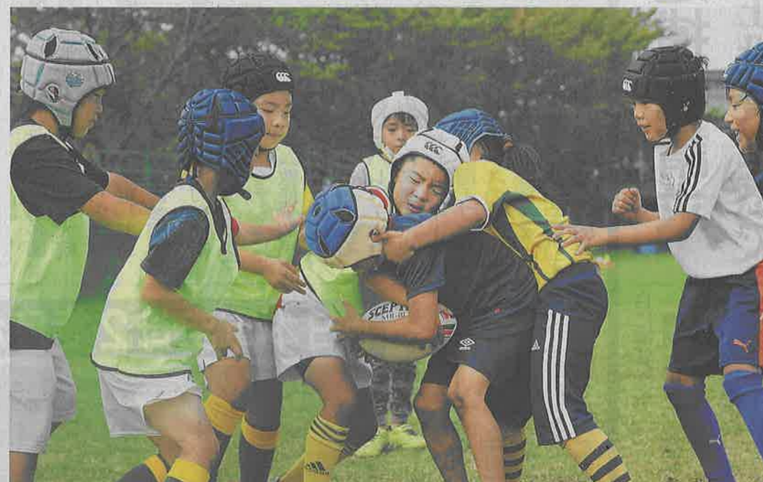
「しながわバンブーラグビークラブ」で練習する子どもたち＝20日、東京都大田区

子ども憧れスクール盛況 目指せ、桜の戦士。ラグビー・ワールドカップ(W杯)準々決勝で南アフリカに敗れたものの、日本代表の勇敢な戦いぶりは熱狂を巻き起こした。「リーチ・マイケルみたいになりたい」。ラグビースクールに集まる子どもたちは憧れを口にし、保護者も「助け合いの精神が学べる」と熱を入れる。裾野を広げる絶好のチャンスに、関係者の期待は高まる一方だ。 【3面参照】