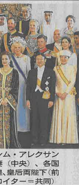
2013年4月、オランダのウィレム・アレクサンダー国王の即位式後、国王夫妻(中央)、各国王族らと記念写真に納まる天皇、皇后両陛下(前列右端)＝アムステルダム